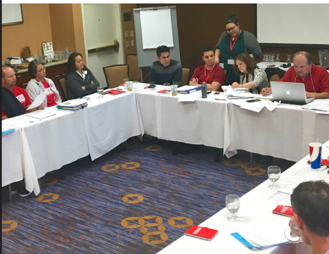
Our bargaining team discusses a response to management's proposals.

WHAT'S BEEN SETTLED: We reached agreements on protecting members against discrimination and harassment, establishing fair grievance and discipline processes, and launching committees to address patient care and health and safety.