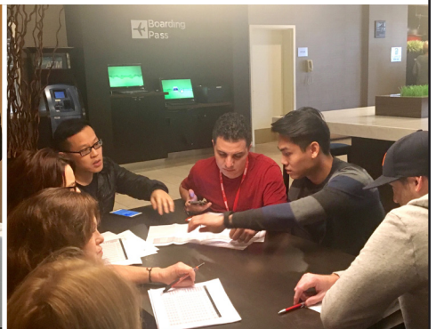
Radiology techs review our wage proposal.

Join us at the next bargaining sessions on February 7 and 8. All members welcome!