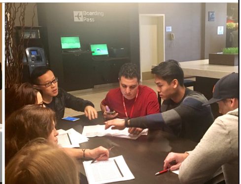
Técnicos de radiología revisan nuestra propuesta sobre sueldos.

Acompáñenos en la próxima sesión de negociaciones el 7 y 8 de febrero.